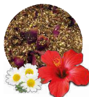
多种原料与茶叶混合